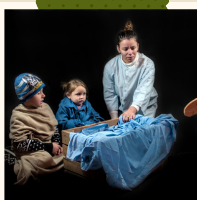
BORALDA, QEMAL, QUITTRIONA

"La crèche, c'est l'Eglise ouverte, l'Eglise à ciel ouverte, celle qui n'est pas dans la salle commune et qui n'est pas "commune". J'aime l'humilité et la délicatesse de l'âne qui réchauffe Jésus de son souffle Jésus