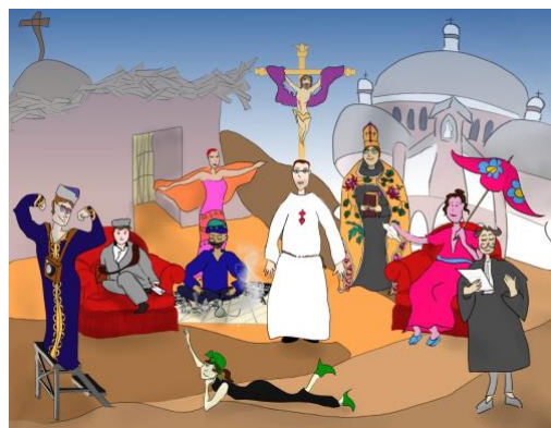
Dessin de la pièce de Ludivine

Atelier théâtre, les mercredis de 15h à 17h.